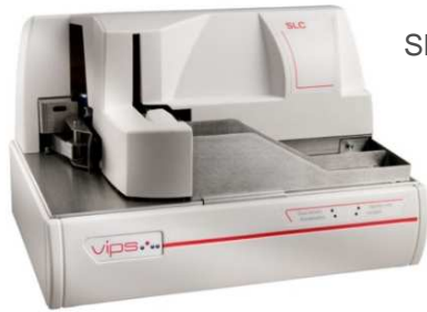
SLC double cases