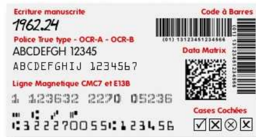
Types de données pouvant être extraites et traitées