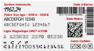
Exemples d'information pouvant être extraites et traitées