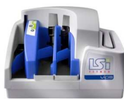
LSI Double Case